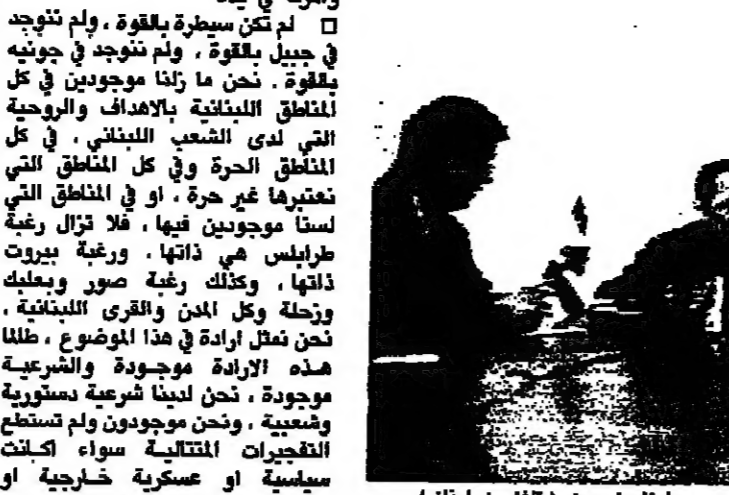
المدعو عن خاتمة حديثه الى وزير... ورئيس... وفريقهم في الاجتماع.